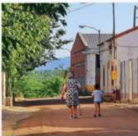
Una persona pasea con su perro por la calle de un pueblo. (1)

TERAPIA OCUPACIONAL. ¿Cómo puede ayudar la terapia ocupacional en este momento? Desde esta disciplina se intenta hacer modificaciones de la vida de intervención, ayudando a generar nuevas redes sociales, aumentando la forma de participación social, las nuevas tecnologías. En el caso de las personas, se intenta dar apoyo y apoyo que ha sido muy difícil y complejo y otros que nos rodean en