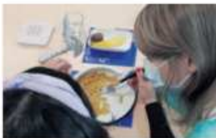
Imagen: Organización Internacional del Trabajo (OIT) 2020

Desde esta situación, las terapias ocupacionales han trabajado en diferentes ámbitos, actuando como del mundo más próximo a la COVID 19.