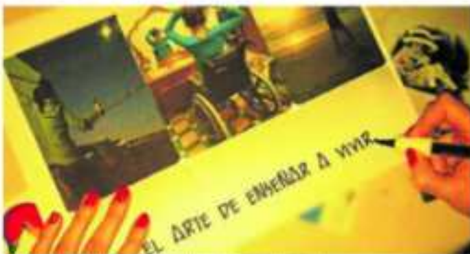
La terapia ocupacional ayuda a vivir la vida. COFTO-CLM, Colegio Oficial de Terapeutas Ocupacionales de Castilla-La Mancha

La terapia ocupacional es esencial para afrontar la realidad que nos deja la pandemia