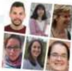
Junta Directiva de SOCINTO

Para la consecución de estos objetivos, SOCINTO está en contacto con diferentes órganos de gobierno en defensa de los intereses de la profesión, y contribuye en el desarrollo de planes y estrategias que incluyen a los terapeutas ocupacionales. Del mismo modo, y en calidad de sociedad científica, proporciona avalés a iniciativas con carácter académico-investigador que contribuyen a la Terapia Ocupacional. Entre las líneas de actuación de SOCINTO se encuentra la elaboración de documentos de referencia. En este sentido, destacamos el Documento Básico de Terapia Ocupacional en Atención Primaria que tiene por objetivo justificar la incorporación de nuestra perfil en este ámbito y fue presentado en 2019 al Ministerio de Sanidad. Disponible para su consulta aquí . Otras iniciativas y recursos, como la creación de una plataforma donde los terapeutas ocupacionales pueden incluir o consultar tesis doctorales y artículos científicos relacionados con la disciplina, están disponibles en nuestro web ( www.socinto.org ).