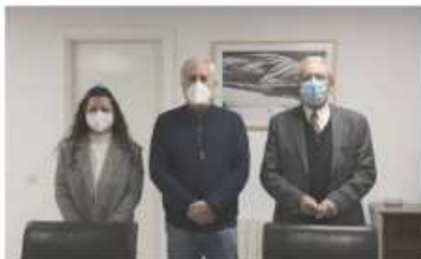
Reunión de la firma del convenio de colaboración. 2 de octubre de 2021

Desde la web de Fundación CB, Caja Badajoz, 'Miradas' se informa del convenio de colaboración con Aprosuba 3 Plena Inclusión Badajoz a través del cual se realizarán actividades deportivas destinadas a personas de la asociación con discapacidad intelectual o del desarrollo de diferentes edades