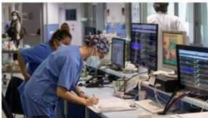
Por cada 1.000 habitantes había colegiados en Extremadura 3,57 médicos y 176 enfermeros.