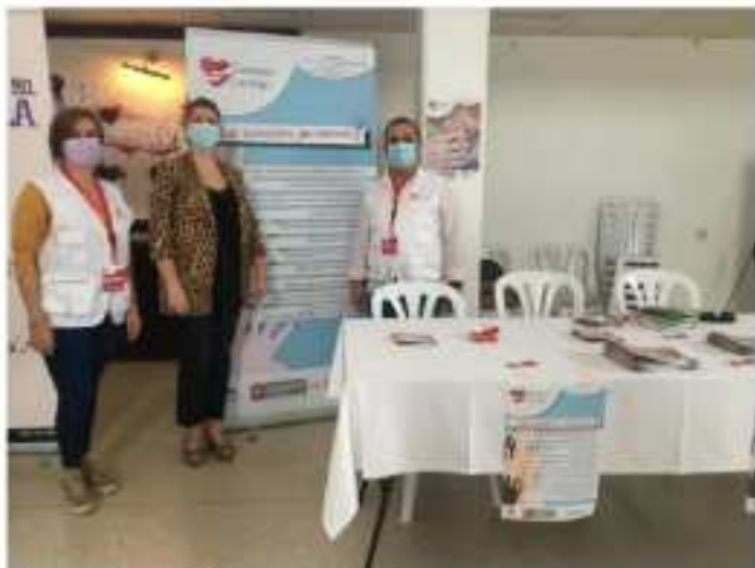
La localidad posa en la mesa informativa junto a terapeutas, F.O.S.

Un programa regional, dotado con 214.000 euros, permite contratar a profesionales para dar las mismas prestaciones que en una residencia