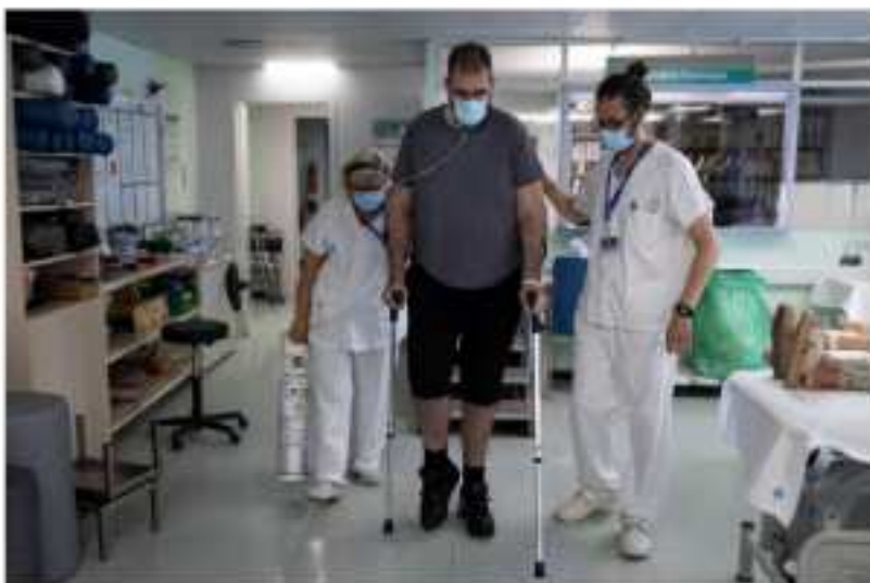
Un joven de 20 años usa un andador de cuatro ruedas después de haber estado ingresado en la UCI por covid persistente en el Hospital Carlos III de Madrid.

Alrededor de 1 de cada 100 personas de entre 10 y 30 años que se infecte necesitará hospitalización. El Instituto Carlos III ha contabilizado 80.543 casos que han requerido ingreso, más de 800 en la UCI, desde el primer estado de alarma