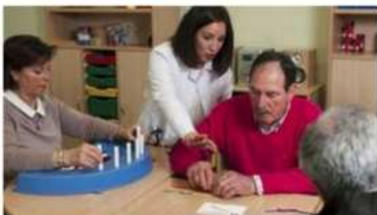
El panel sobre el Terapeuta Ocupacional con la colaboración